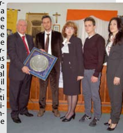
Premio della vita assegnato all'A.C. di Lampedusa