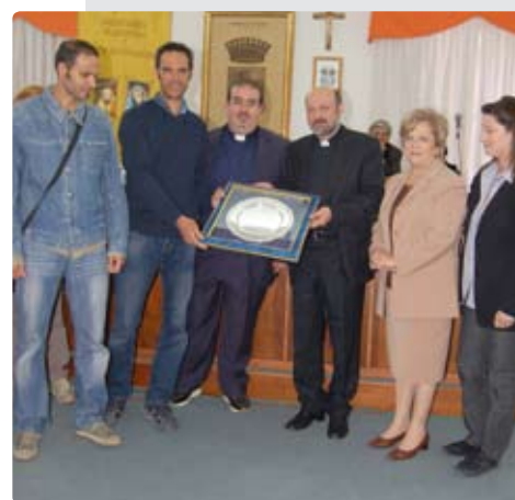
Premio della bontà assegnato alla Chiesa di Lampedusa