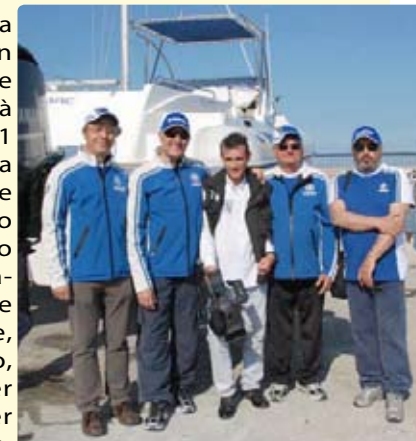
L'equipaggio palermitano del gommone Colbac