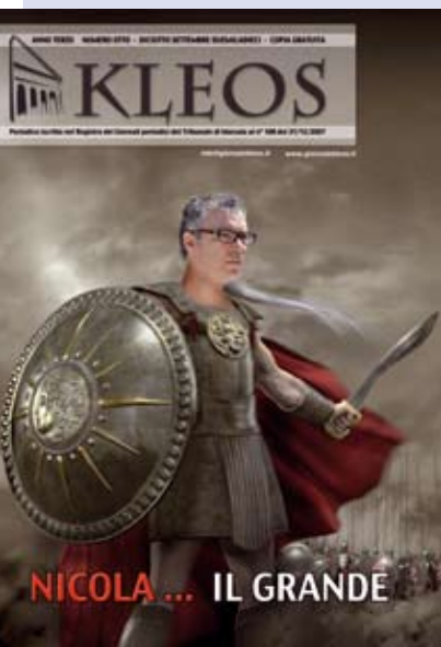
Copertina di Kleos 18 settembre 2010