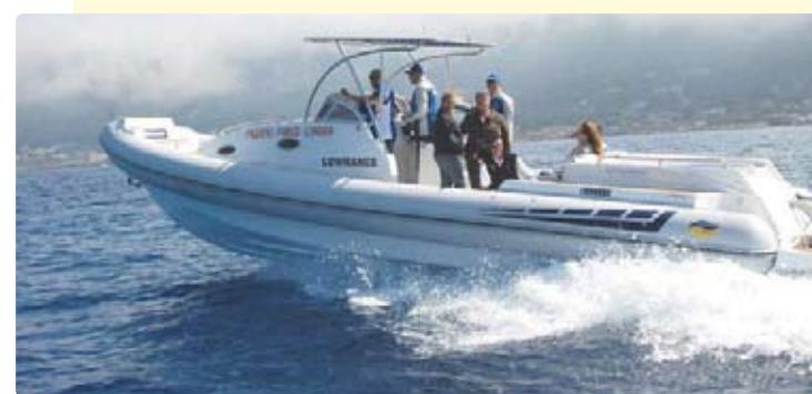
Il Gommone Colbac pronto per la traversata Palermo, Parigi, Londra