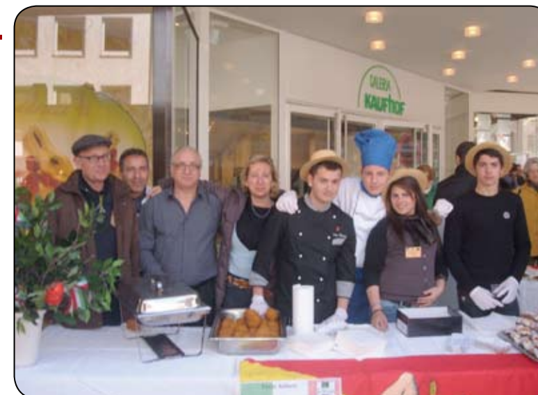
Un momento del gemellaggio tra le due scuole

Dal 12 al 19 aprile 2011, l'Istituto Alberghiero "V. Titone" di Castelvetro è stato ospite della Provincia Regionale di Hildesheim. La città situata nella Bassa Sassonia, nella zona Nord-occidentale della Germania, è sede della "Walter Gropius Schule", un istituto di Formazione professionale con indirizzo di Gastronomia. L'attività è stata anche sostenuta dall'Associazione Italo-tedesca di Hildesheim, in cui sono presenti molti castelvetranesi che costituiscono un punto di riferimento per la comunità tedesca, in quanto imprenditori, soprattutto in ambito ristorativo e turistico. Nel corso del soggiorno della scuola castelvetranese è stata stipulata una convenzione di collaborazione che favorirà la possibilità che gli alunni dei due istituti possano effettuare esperienze di stage lavorativo in ristoranti e strutture ricettive del territorio, frequentando contemporaneamente dei corsi di lingua presso la scuola gemella. Gli alunni e la delegazione di Hildesheim saranno ospiti del territorio castelvetranese già nella primavera del 2012, quando ricambieranno la visita offerta. L'iniziativa è stata caldamente sostenuta da entrambe le scuole, poiché è fondamentale per gli alunni che si