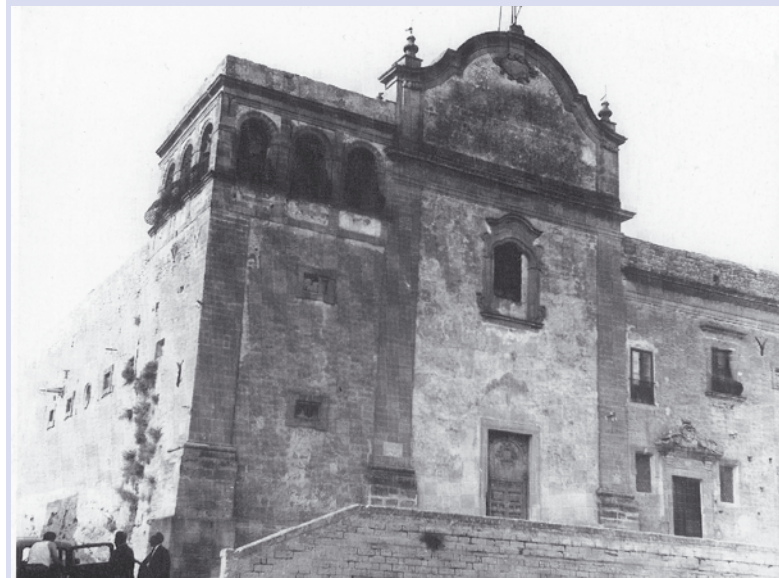
Chiesa di San Benedetto

Ancora oggi esistente, anche se in pessimo stato di conservazione, il Complesso Conventuale dei Cappuccini, costituito da